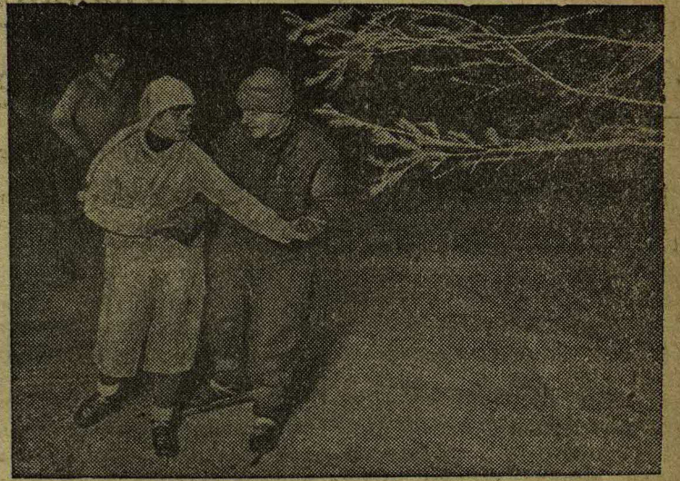
Вечером на Хабаровском катке „Динамо“.