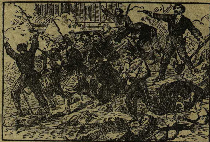
В последний бой (1871 г.)